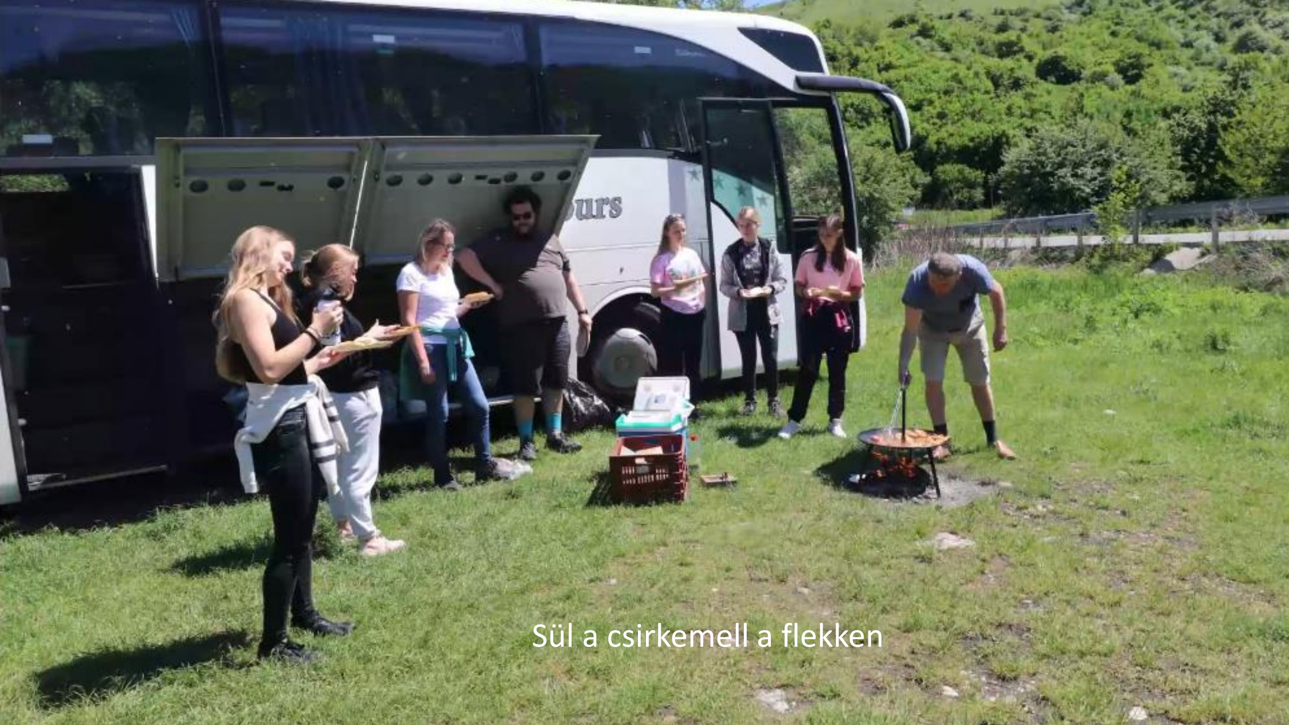
Sül a csirkemell a flekken