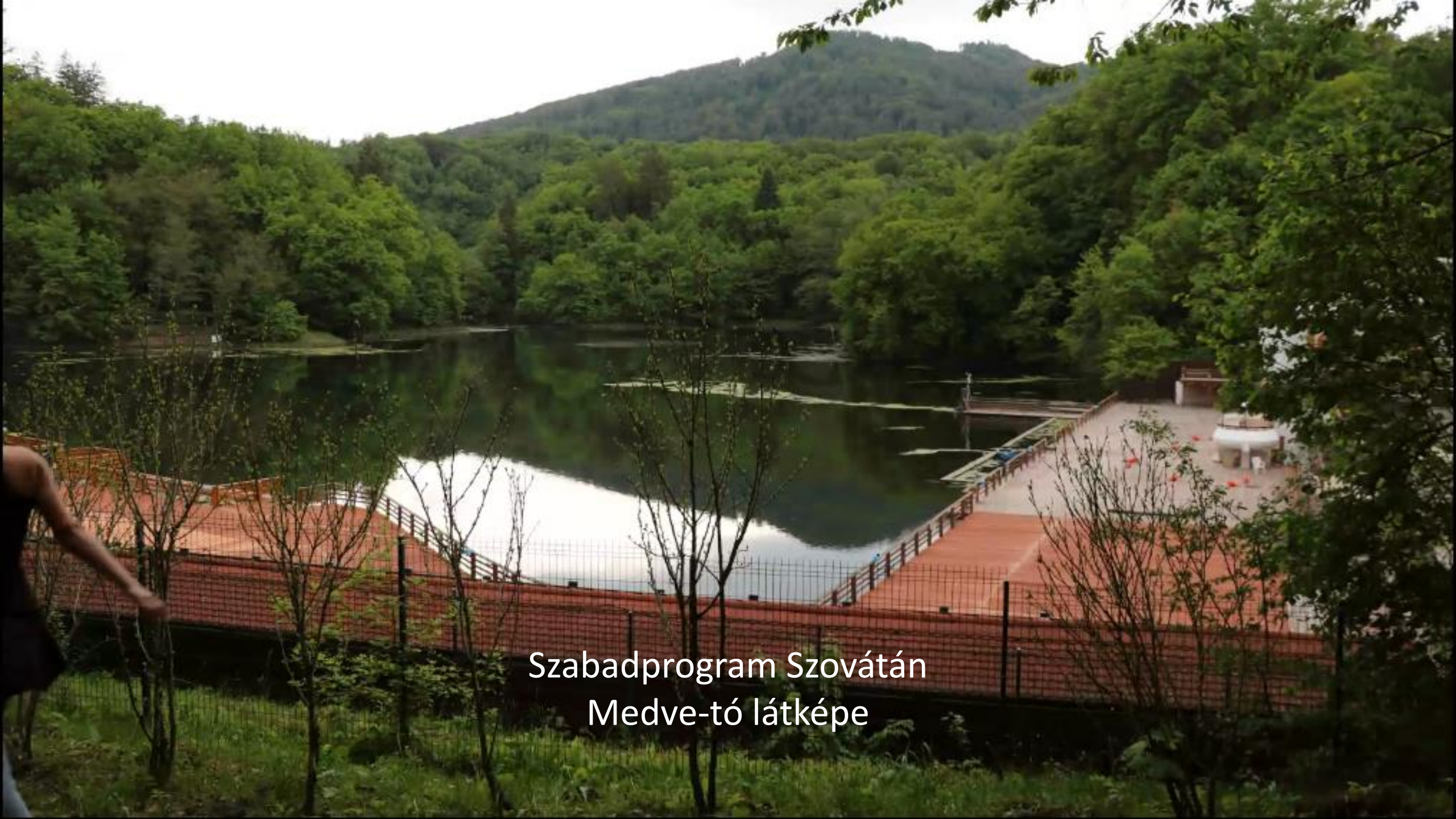
Szabadprogram Szovátán Medve-tó látképe